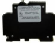
9926251925 Weidmuller CIR BRKR MAG-HYDR 25A 80VDC