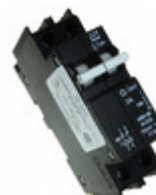
9926252002 Weidmuller CIR BRKR MAG-HYDR 2A 240VAC