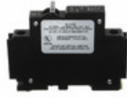
9926251935 Weidmuller CIR BRKR MAG-HYDR 35A 80VDC