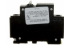
9926251945 Weidmuller CIR BRKR MAG-HYDR 45A 80VDC