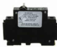
9926251940 Weidmuller CIR BRKR MAG-HYDR 40A 80VDC