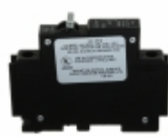
9926251960 Weidmuller CIR BRKR MAG-HYDR 60A 80VDC