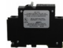
9926251930 Weidmuller CIR BRKR MAG-HYDR 30A 80VDC