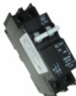
9926252001 Weidmuller CIR BRKR MAG-HYDR 1A 240VAC