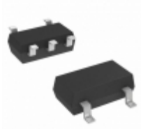
NC7SZ86P5X Fairchild/ON Semiconductor IC GATE XOR 1CH 2-INP SC-70-5