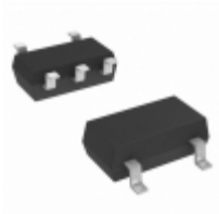
NC7SZ86P5 Fairchild/ON Semiconductor IC GATE XOR 1CH 2-INP SC-70-5