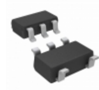
NC7SZD384M5 AMI Semiconductor / ON Semiconductor IC BUS SWITCH 1BIT LEVEL SOT23-5