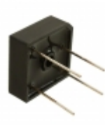
MP508W-BP Micro Commercial Co RECT BRIDGE 50A 800V WIRE LEADS