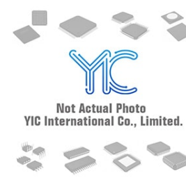
MP5087AGG-P Monolithic Power Systems Inc. IC LOAD SWITCH 5.5V 7A