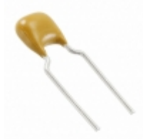
C322C221KAG5TA KEMET CAP CER RAD 220PF 250V COG 10%