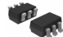
74HCT2G16GWH Nexperia USA Inc. IC BUFFER DUAL NON-INV SOT363