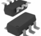
74HCT2G14GV-Q100H Nexperia USA Inc. IC INVERTER SCHMITT TRIG SC- 74