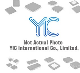
74HCT2G14GV NXP 74HCT2G14GV NXP