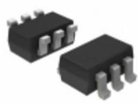
74HCT2G14GW,125 Nexperia USA Inc. IC SCHMITT TRIG DL INV 6TSSOP