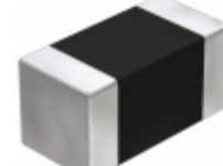
JMK105F474ZV-F Taiyo Yuden CAP CER 0.47UF 6.3V Y5V 0402