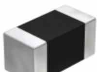
JMK105F105ZV-F Taiyo Yuden CAP CER 1UF 6.3V Y5V 0402