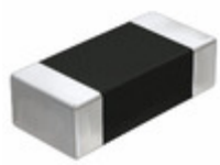
JMK107ABJ106MA-T Taiyo Yuden CAP CER 10UF 6.3V X5R 0603