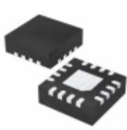
PIC16F630T-I/ML Microchip Technology IC MCU 8BIT 1.75KB FLASH 16QFN