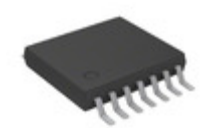
PIC16F630T-I/ST Microchip Technology IC MCU 8BIT 1.75KB FLASH 14TSSOP