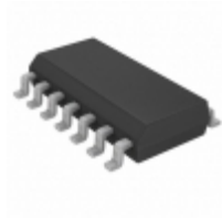
PIC16F630T-I/SL Microchip Technology IC MCU 8BIT 1.75KB FLASH 14SOIC