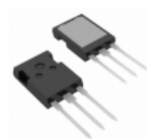
IXFX170N20P IXYS MOSFET N-CH 200V 170A PLUS247