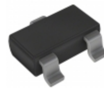
AZ23C2V7-7 Diodes Incorporated DIODE ZENER ARRAY 2.7V SOT23-3