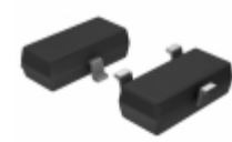
AZ23C27-HE3-08 Electro-Films (EFI) / Vishay DIODE ZENER 27V 300MW SOT23