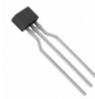
UNR411100A Panasonic Electronic Components TRANS PREBIAS PNP 300MW NS-B1