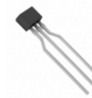
UNR411200A Panasonic Electronic Components TRANS PREBIAS PNP 300MW NS-B1