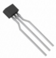
UNR411900A Panasonic Electronic Components TRANS PREBIAS PNP 300MW NS-B1