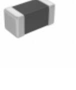
MMZ0402S241CT000 TDK Corporation FERRITE BEAD 240 OHM 01005 1LN