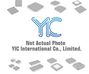
MMZ0602S601CT000 TDK MMZ0602S601CT000 TDK