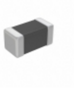
MMZ0402Y750CT000 TDK Corporation FERRITE BEAD 75 OHM 01005 1LN