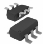
74HC2G16GVH Nexperia USA Inc. IC BUFFER DUAL NON-INV SOT457