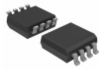
74HC2G32DC,125 Nexperia USA Inc. IC GATE OR 2CH 2-INP 8-VSSOP