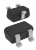
BAT54T,115 NXP USA Inc. DIODE SCHOTTKY 30V 200MA SC75