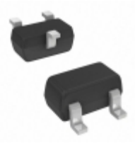
BAT54T-7-F Diodes Incorporated DIODE SCHOTTKY 30V 200MA SOT523