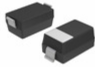
BAT54T1G ON Semiconductor DIODE SCHOTTKY 30V 200MA SOD123