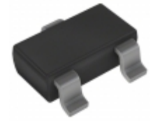
BAT54TC Diodes Incorporated DIODE SCHOTTKY 30V 200MA SOT23-3