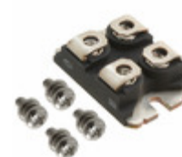
APT50GR120JD30 Microsemi Corporation IGBT 1200V 84A 417W SOT227