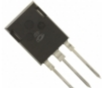
APT50GT120B2RDLG Microsemi Corporation IGBT 1200V 106A 694W TO-247