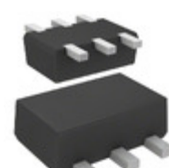
DMC564030R Panasonic Electronic Components TRANS PREBIAS DUAL NPN SMINI6