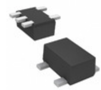
DMC562050R Panasonic Electronic Components TRANS 2NPN PREBIAS 0.15W SMINI5