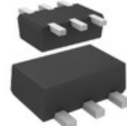
DMC564000R Panasonic Electronic Components TRANS PREBIAS DUAL NPN SMINI6