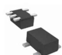
DMC562000R Panasonic Electronic Components TRANS 2NPN PREBIAS 0.15W SMINI5