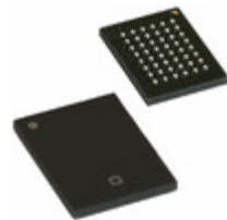
CY62157EV18LL-45BVXI Cypress Semiconductor Corp IC SRAM 8MBIT 45NS 48VFBGA