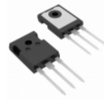
IXGH16N170A IXYS IGBT 1700V 16A 190W TO247