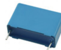
B32523Q3335K189 EPCOS (TDK) CAP FILM 3.3UF 10% 250VDC RADIAL