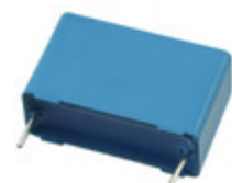
B32523Q3335J289 EPCOS (TDK) CAP FILM 3.3UF 5% 250VDC RADIAL