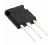
APT50GT120B2RDQ2G Microsemi Corporation IGBT 1200V 94A 625W TO247