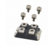
APT50GT120JU3 Microsemi Corporation IGBT 1200V 75A 347W SOT227