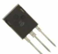
APT50GT120B2RDLG Microsemi Corporation IGBT 1200V 106A 694W TO-247