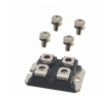
APT50GT120JU2 Microsemi Corporation IGBT 1200V 75A 347W SOT227