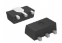
S-1131B18UA-N4DTFG SII Semiconductor Corporation IC REG LDO 1.8V 0.3A SOT89-3