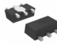
S-1131B17UC-N4CTFG SII Semiconductor Corporation IC REG LDO 1.7V 0.3A SOT89-5