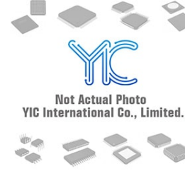
PMEG2005EJ NXP PMEG2005EJ NXP