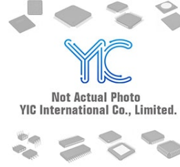
PMEG2005EL NXP PMEG2005EL NXP