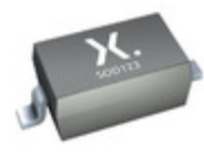
PMEG2005EGWX Nexperia DIODE SCHOTTKY 20V 500MA SOD123