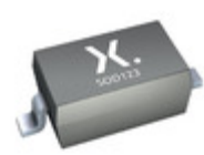
PMEG2005EGWJ Nexperia DIODE SCHOTTKY 20V 500MA SOD123