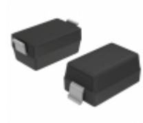
BA782-HG3-18 Vishay Semiconductor Diodes Division DIODE BAND SW 100MA SOD123