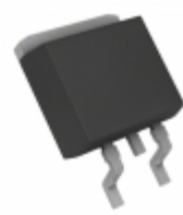
BA7820FP-E2 Rohm Semiconductor IC REG LDO 20V 1A TO252-3