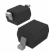
BA782S-E3-18 Electro-Films (EFI) / Vishay DIODE BAND SW 100MA SOD323