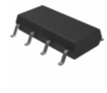
AQW280SZ Panasonic RELAY OPTO AC/DC 350V 100MA 8SOP