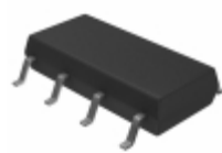
AQW280S Panasonic RELAY OPTO AC/DC 350V 100MA 8SOP