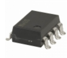
AQW282EHAX Panasonic RELAY OPTO AC/DC 60V 400MA 8-SMD