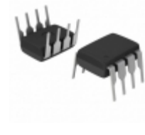
AQW282EH Panasonic RELAY OPTO AC/DC 60V 400MA 8-DIP