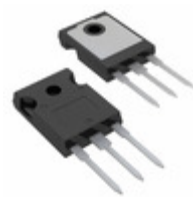
IRGP6630DPBF Infineon Technologies IGBT 600V 47A 192W TO247AC